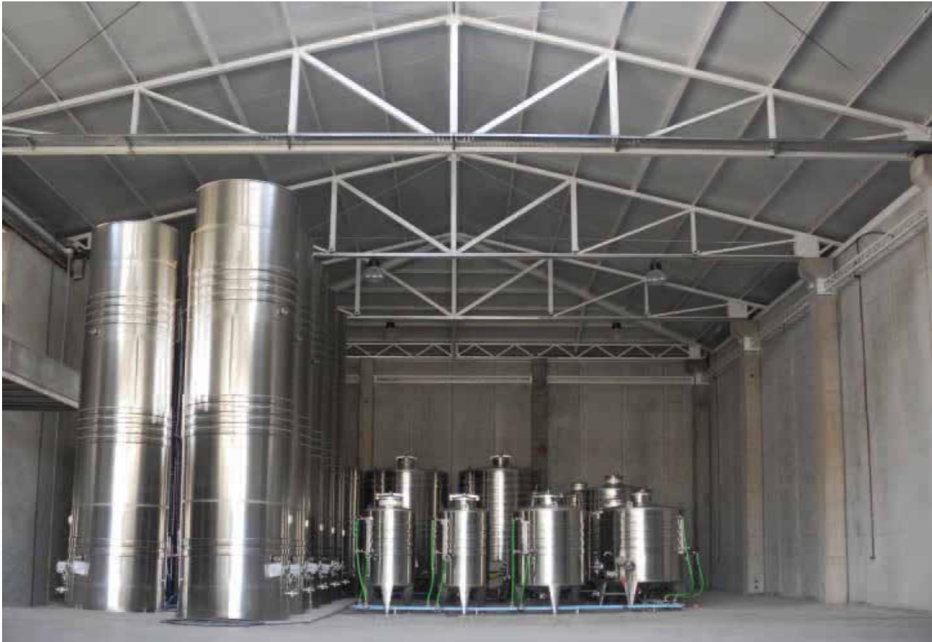
Cumple con la norma: NOM-008-200-1994.